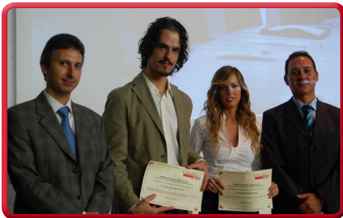
Entrega de Premios Cátedra CEPESA.08

En el Acto de Graduación y Lección Inaugural del Curso 08-09 de la Escuela Politécnica Superior de Algeciras, celebrado el 17 de octubre, se realizó la entrega de los Premios (Talón y diploma) CATEDRA CEPESA-08.