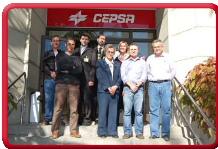
Visita de una representación de Vladimir State University (Rusia), 18.Nov.08.

La Cátedra CEPSA ha concertado diversas visitas de alumnos y grupos de la UCA a las instalaciones de Refinería "Gibraltar-San Roque", colaborando además con la UCA en el proyecto internacional de relaciones Universidad-Empresa TEMPUS-COIN.