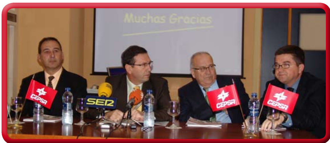
Presentación Memoria Actividades-07, Dic. 2.008.

La rueda de prensa se celebró en la Escuela Politécnica Superior de Algeciras.