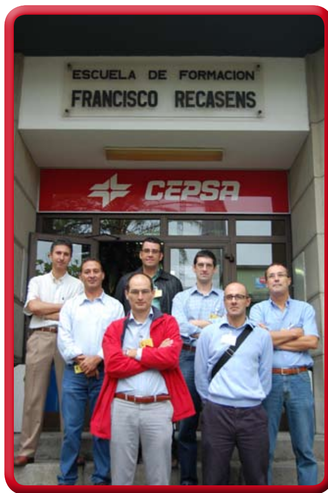
Recepción de profesores UCA: Lunes 29 de septiembre.