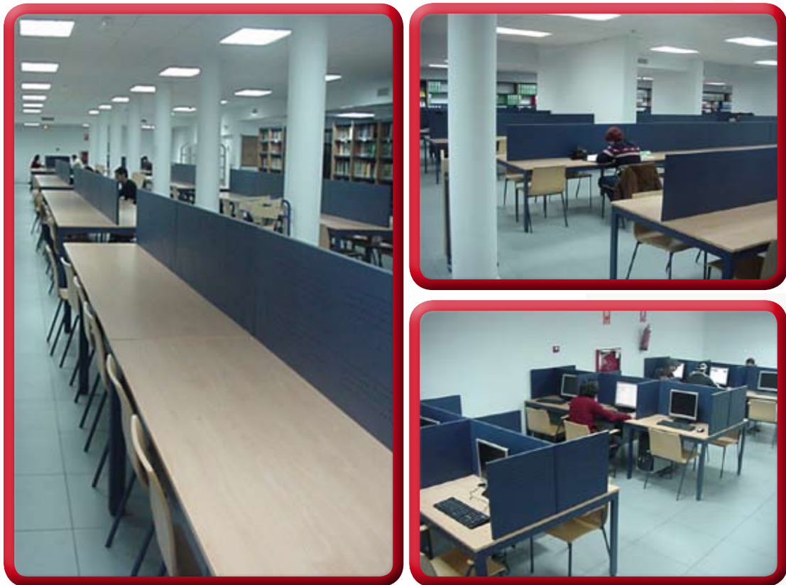
Instalaciones de la Biblioteca UCA en el Campus de Algeciras.