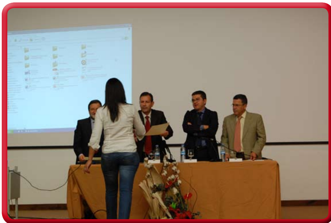
Acto de clausura y entrega de diplomas- Experto Mantenimiento- junio-08