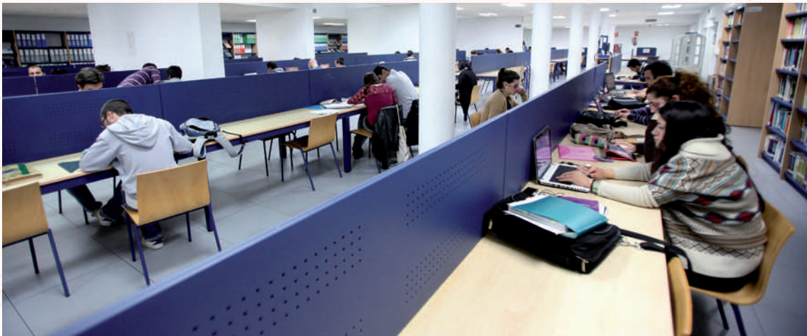
Instalaciones de la Biblioteca UCA en el Campus de Algeciras.

El procedimiento consiste simplemente cumplimentar una hoja que puede descargarse desde la web, entregándola junto con una foto de carnet y la fotocopia del DNI al jefe de Formación de la Refinería.